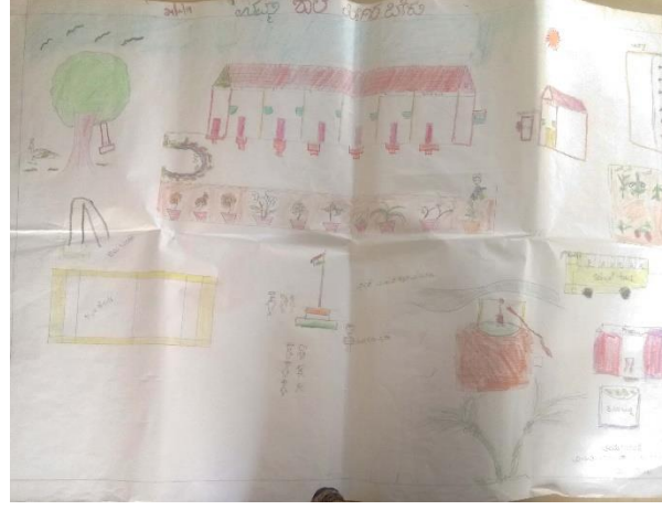
ಚಿತ್ರ 4: ನಮ್ಮ ಶಾಲೆಯಲ್ಲಿ ಇರಬೇಕಾದ ವ್ಯವಸ್ಥೆಗಳನ್ನು ಇಲ್ಲಿ ಚಿತ್ರಿಸಿದ್ದೇವೆ

ವಿಷಯದ ಶಿಕ್ಷಕರು ಇರುತ್ತಾರೆ. ನಮ್ಮ ಶಾಲೆಯಲ್ಲಿ ನಮ್ಮ ಸಮಸ್ಯೆಗಳನ್ನು ಅರ್ಥ ಮಾಡಿಕೊಂಡು ಅವುಗಳನ್ನು ಬಗೆಹರಿಸುವ ಸಾಮರ್ಥ್ಯವನ್ನು ಶಿಕ್ಷಕರು ಹೊಂದಿರುತ್ತಾರೆ. ನಮ್ಮ ಶಾಲೆಯ ಸುತ್ತಮುತ್ತಲಿನ ವಾತಾವರಣ ಕಲುಷಿತವಾಗಿರುವುದಿಲ್ಲ. ನಮ್ಮ ಊರು ಸ್ವಚ್ಛವಾಗಿದ್ದರೆ ಊರಿಗೆ ಜನರೂ ಕೂಡ ಆರೋಗ್ಯವಾಗಿರುತ್ತಾರೆ. ಆಟವನ್ನು ಆಡಲು ಒಳ್ಳೆಯ ಸ್ಥಳ ಇದೆ. ನಮಗೆ ಶಾಲೆಗಳಿಗೆ ಹೋಗಲು ವಾಹನಗಳು ಇರುತ್ತದೆ. ನಮ್ಮ ಶಾಲೆಯ ಸುತ್ತಮುತ್ತಲಿನ ವಾತಾವರಣವು ಚೆನ್ನಾಗಿರುತ್ತದೆ. ನಾವು ಆಟವಾಡುವಾಗ ಶಿಕ್ಷಕರು ಸೇರಿಕೊಳ್ಳುತ್ತಾರೆ.