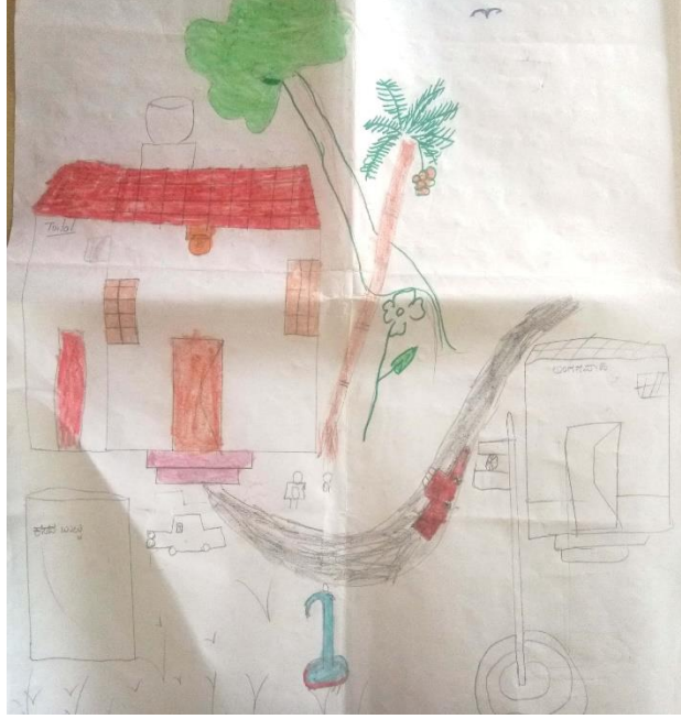
ಚಿತ್ರ 4: ನಮ್ಮ ಊರಿನಲ್ಲಿ ಇರಬೇಕಾದ ವ್ಯವಸ್ಥೆಗಳನ್ನು ಇಲ್ಲಿ ಚಿತ್ರಿಸಿದ್ದೇವೆ