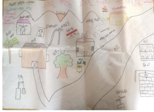
ಚಿತ್ರ 3: ಇಲ್ಲಿ ನಮ್ಮ ಊರಿನಲ್ಲಿ ನಮ್ಮ ರಕ್ಷಣೆಗೆ ಬೇಕಾದ ವ್ಯವಸ್ಥೆಗಳನ್ನು ಚಿತ್ರಿಸಿದ್ದೇವೆ

ರಿತಿಯ ಜಾತಿ ಬೇಧ ಭಾವ ಇರುವುದಿಲ್ಲ. ನಮ್ಮ ಊರು ಸ್ವಚ್ಛವಾಗಿದ್ದರೆ ಊರಿನ ಜನರೂ ಕೂಡ ಆರೋಗ್ಯವಾಗಿರುತ್ತಾರೆ. ಕೌಟುಂಬಿಕ ಸಮಸ್ಯೆ ಇರುವುದಿಲ್ಲ.