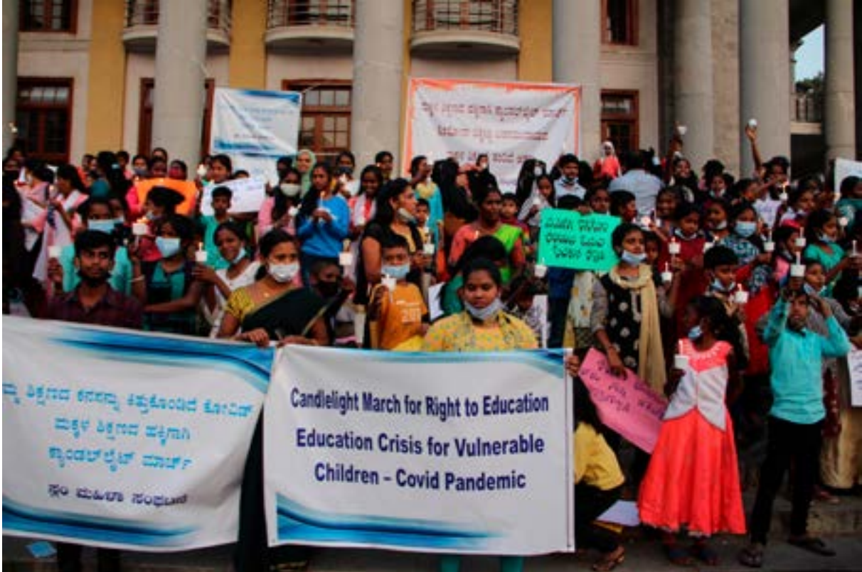
Candlelight March by Slum Mahila Sanghatane – Covid Crisis Impact on Children's Education