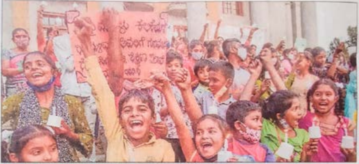
ಮೇಣದ ಬತ್ತಿ ಬೆಳಗಿ ಪ್ರತಿಭಟನೆ ನಡೆಸಿದ ಮಕ್ಕಳು